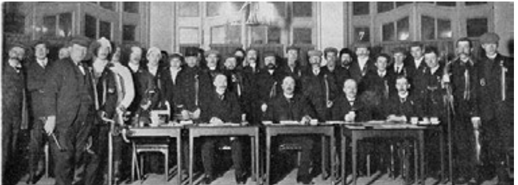
Deelnemers eerste elfstedentocht 1909

Deze bijdrage is ingestuurd door Rob Westerik