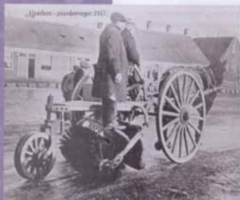
Haarlem - paardveger 1917

De eerste volledig geautomatiseerde baanveger verscheen in 1925 in het Zwitserse Davos: een stevige cabriolet die aan de voorkant voorzien was van een meter hoge schuiver waarmee de ijsbaan razendsnel sneeuwvrij gemaakt kon worden. Toch moesten er daarna nog vele baanvegers