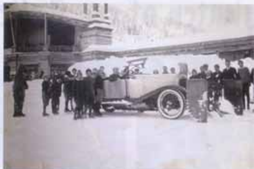
Auto-sneeuwschuiver in Davos 1925

De enige van wie de baanveger van oudsher concurrentie ondervond was het paard. Zoals het paard al eeuwenlang werd ingezet voor de