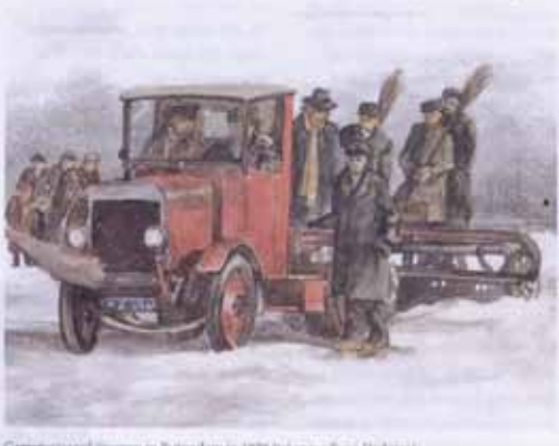
Geautomatiseerd ijsvegen in Davos in 1925 (tekstueel: Rein Dijkster)