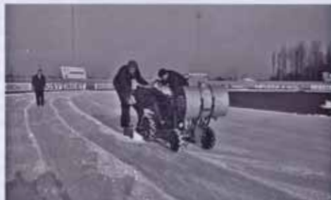
De dwelwaterbaan bij het EK in Deventer 1966.

De 'Zamboni' was geboren en zou de wereld veroveren, eerst de Amerikaanse ijshallen, maar vanaf 1960 (Winterspelen in Squaw Valley) ook de 400 meter-banen. Alleen in Euro-